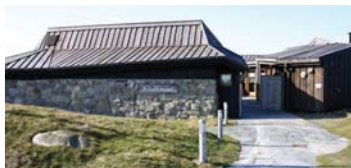
Friluftshuset Orre, Klepp