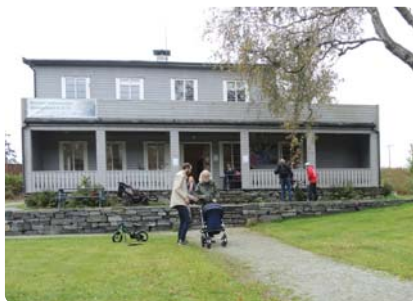
Mostun natursenter, Stavanger

Kontaktadresse JVS: Tlf. 51 52 88 11 / 977 12 253 / e-post: post@mostun.no