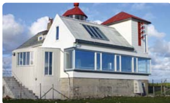
Friluftsfyret Kvasheim, Hå