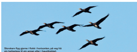
Storskarv flyg gjerne i flokk i horisonten, på veg frå ein borteplass til ein annan eller i hausttrekket.