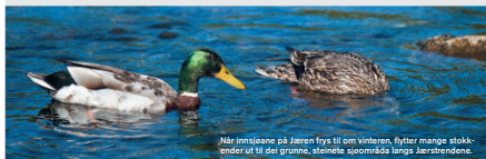
Når reinisloane på Jæren frys til om vinteren, flyttar mange stokkendrer ut til dei grunne, steinleie sjøområda langs Jærstrendene.

På det store, åpne havet er det spesialistane som dominerer. Det er dykkarar, lommar, skarv og alkefuglar som er eminente djupvassdykkarar. Ein av dem, islommen, kan forfølge og fange eit bytte ned til 70 meter.